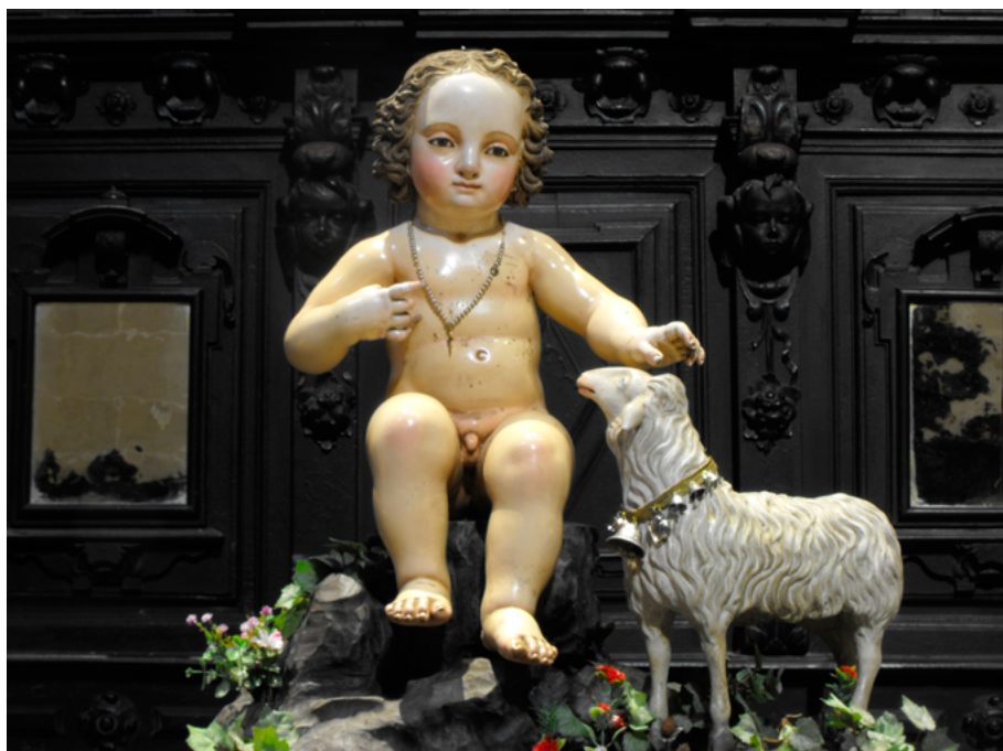
FIG. 3. Niño Jesús, Convento de Santo Domingo de Jerez de la Frontera, Cádiz (Gabriel de Astorga, 1861).

el acentuado giro de cabeza a su derecha y la inclinación del cuerpo, en actitud de rechazo, hacia el lado contrario, movimiento marcado por la diagonal que crea la pierna diestra. Los manos tapan uno de los senos, sosteniendo un paño que pende hasta ocultar el vientre. La figura se asienta sobre una piedra. Sobre ella ha sido grabada la firma del artista: «Gabriel Astorga / Sevilla 1849» (FIG. 2).