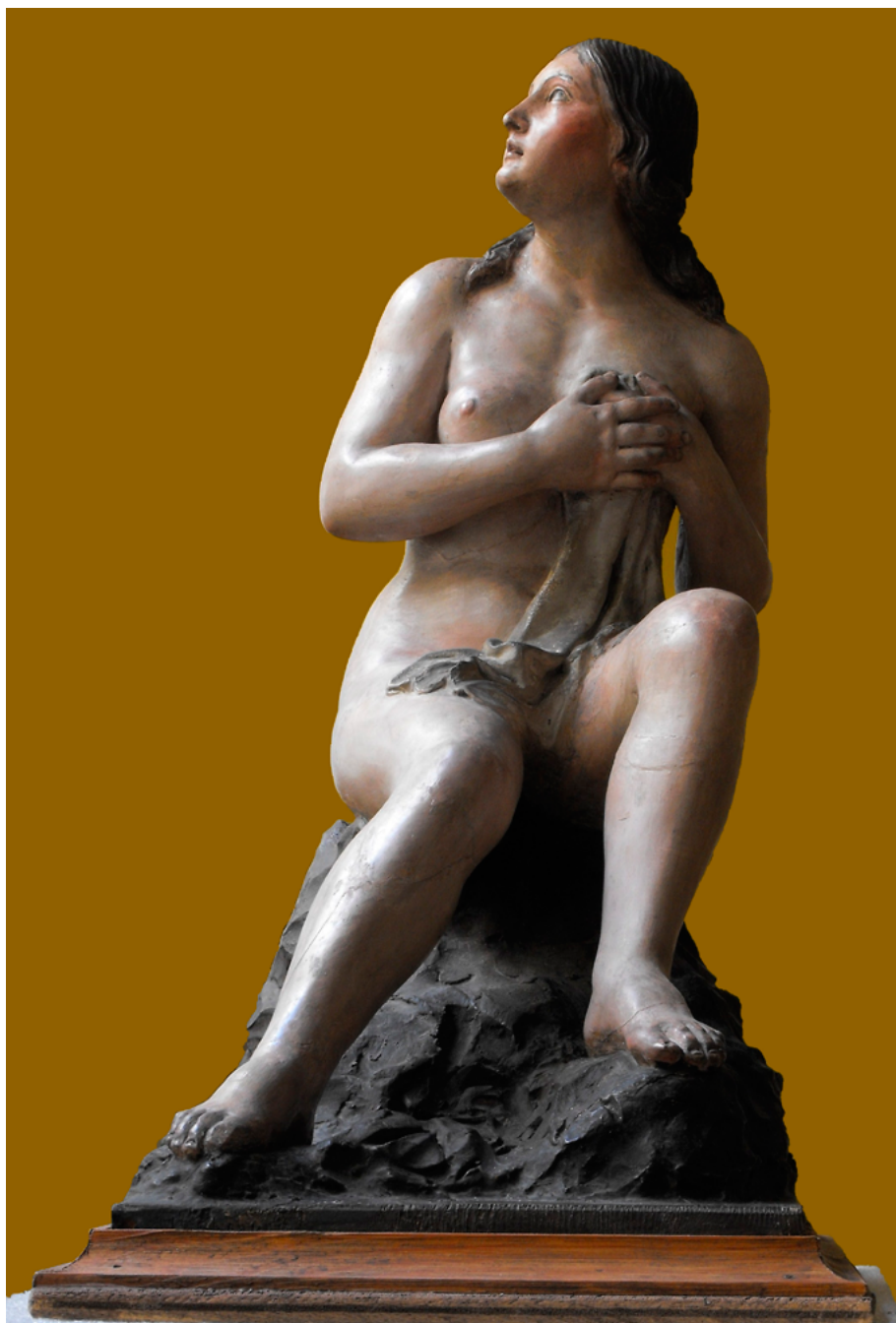
FIG. 1. La Casta Susana , Museo Provincial de Cádiz (Gabriel de Astorga, 1849).