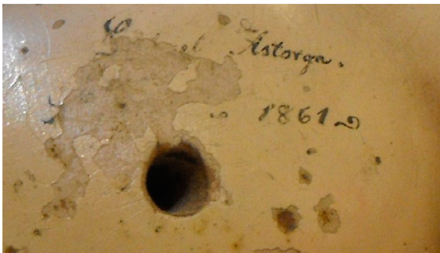
FIG. 4. Niño Jesús, Convento de Santo Domingo de Jerez de la Frontera. Firma del autor.