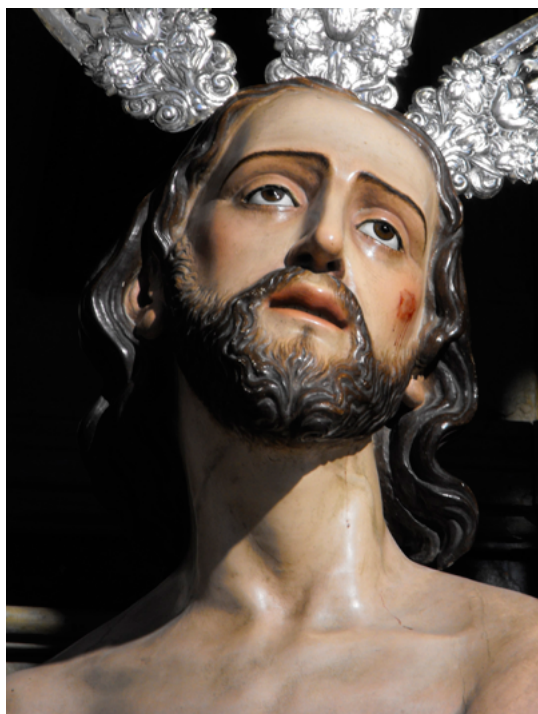
FIG. 6. Nuestro Padre Jesús de la Salud , Parroquia de la Purísima Concepción de Trebujena. Detalle.

de las dolorosas de su autor, como la Virgen de las Angustias de La Laguna, Tenerife (1866), 16 o con la Magdalena de la hermandad del Nazareno de Peñaflor (1861), 17 obras, las citadas, con las que comparte también similar tratamiento del cabello, plasmado a base de mechones ondulantes, y la misma postura de la cabeza con la mirada elevada hacia el cielo (FIG. 6). La disposición de los brazos y el contraposto que dibujan las piernas aportan movimiento a la figura. La anatomía es de cierta corrección. Por su parte, el sudario, sostenido por una cuerda, se ha resuelto mediante una composición asimétrica, de gruesos y angulosos pliegues.