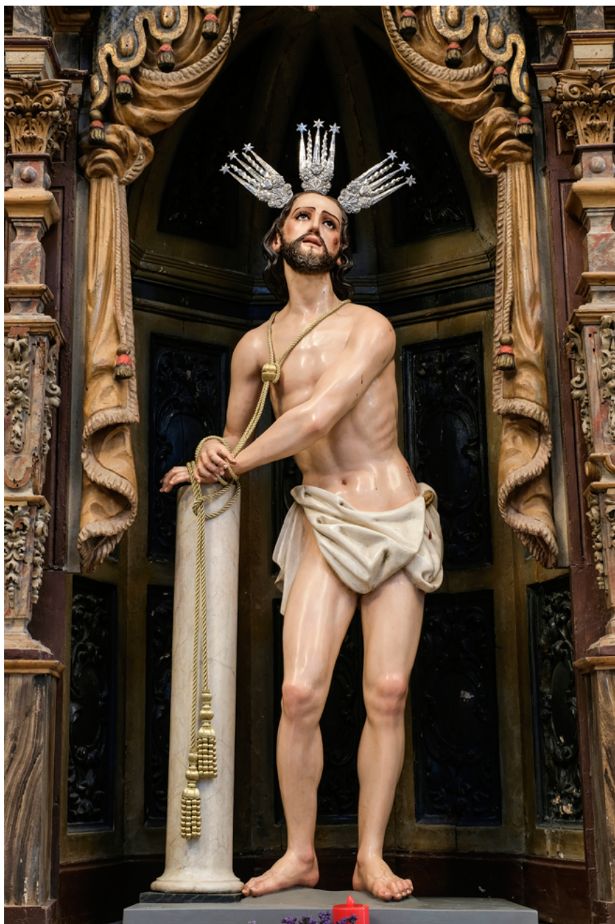
FIG. 5. Nuestro Padre Jesús de la Salud , Parroquia de la Purísima Concepción de Trebujena, Cádiz (atribuido a Gabriel de Astorga).